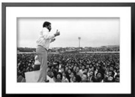
Lula en los años 80

Todas las opiniones que hemos podido recoger durante la elaboración de este trabajo coinciden en destacar el gran momento de esperanza que vive Brasil tras la victoria de Lula: desde el que consideramos sin duda el movimiento actualmente más poderoso de América Latina, el Movimiento de los Trabajadores Rurales sin Tierra 1 , el IBase -Instituto Brasileiro de Análises Sociais e Econômicas-, intelectuales de izquierdas como Frei Betto 2 , y todos los movimientos sociales que han mostrado su apoyo a Lula, como la CONTAG -Confederação Nacional dos Trabalhadores na Agricultura-, la CUT -Central Única dos Trabalhadores- y el propio Partido de los Trabajadores, el PT, vencedor después de tres intentos con Lula como candidato, ahora presidente electo de Brasil, quien enfatizó en su primer discurso a la nación tras la victoria que su país “está cambiando en paz, y lo más importante es que la esperanza le ganó al miedo, Brasil votó sin miedo de ser feliz” 3 .